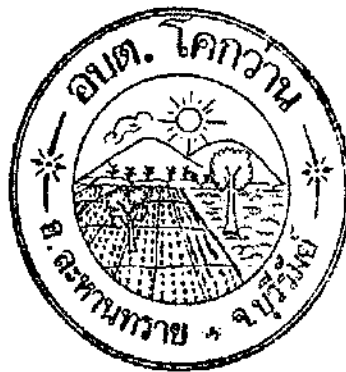
แผนที่ อบต.โคกवान